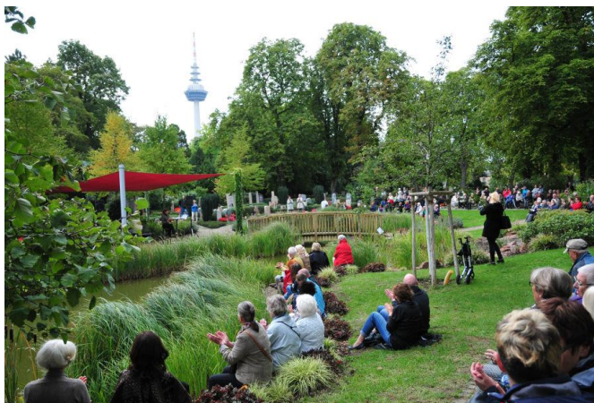
Tag des Friedhofs, Mannheim 2016 - Tag des Friedhofs: Raum für Erinnerung | TASPO.de

In Veranstaltungen, Angeboten und anderer Arbeit eingebunden